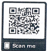
สมัครออนไลน์