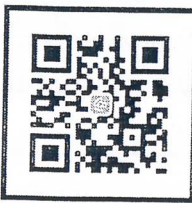
Line สอบถามข้อมูล